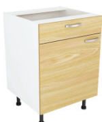
SKAPIS (L / K) - AR TEN ATVILKTNĪ UN PLAUKTU