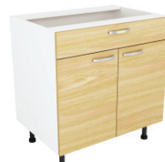
SKAPIS - AR TEN ATVILKTNĪ UN PLAUKTU