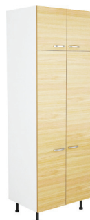
AUGSTAIS SKAPIS H2202 - AR 4 PLAUKTIEM