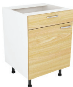
SKAPIS (L / K) - AR UNISET ATVILKTNĪ UN PLAUKTU