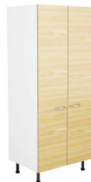
AUGSTAIS SKAPIS H1750 · AR 4 PLAUKTIEM