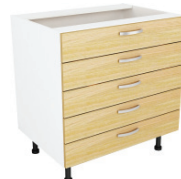
SKAPIS - AR 5 TEN ATVILKTNĒM