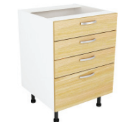
SKAPIS - AR 4 UNISET ATVILKTNĒM