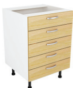
SKAPIS - AR 5 TEN ATVILKTNĒM